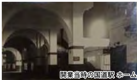
開業当時の国道駅 ホームへ上がる階段は両側にあった