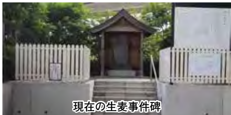
現在の生麦事件碑