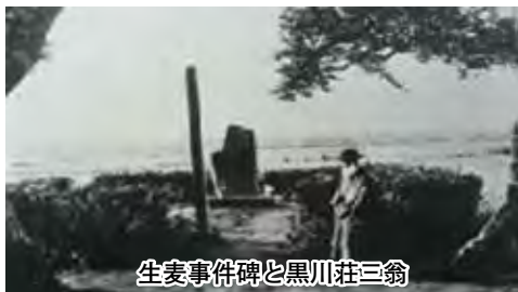
生麦事件碑と黒川荘三翁